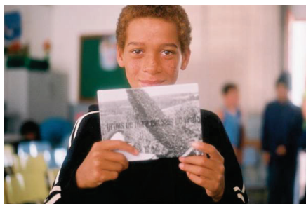
Distrito de São Luiz, área rural de Londrina, PR. Abril/2008.