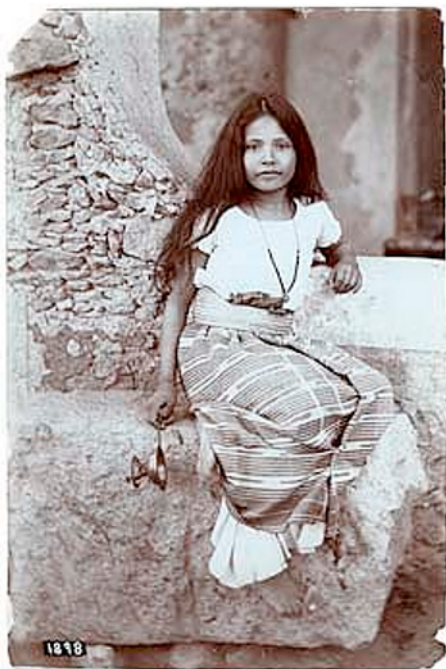
Foto 1. Niña adolescente. Charles B. Waite, 1908 (Archivo General de la Nación).

La lectura e interpretación de las imágenes de los viajeros-antropólogos de la segunda mitad del siglo XIX y su influencia en la reflexión de un pensamiento y una visión sobre los indígenas, el surgimiento de una cultura visual mexicana en los últimos dos siglos,