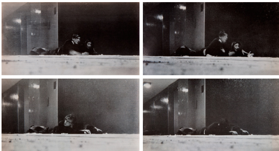
Fotos 5, 6, 7, y 8. Secuencia de la agresión contra la periodista Oriana Fallaci y su asistente en Tlatelolco, México, 2 de octubre de 1968.

Esta reducción empobreció notablemente la riqueza y la heterogeneidad del movimiento y lo redujo a la exhibición de unas cuantas imágenes convertidas en estereotipos. Tomemos el ejemplo de la que constituye quizá la imagen más famosa e influyente del 68, esto es, la secuencia del fotógrafo Jesús Díaz que muestra a la periodista Oriana Fallaci arrastrándose por el piso del Edificio “Chihuahua” el 2 de octubre, la cual fue publicada en México por la revista Life en Español y le dio la vuelta al mundo a través de la agencia UPI.