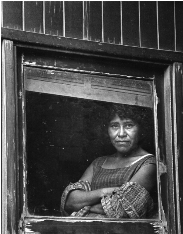
Foto 2. Retrato de mujer en un vagón de segunda clase, México. Rodrigo Moya, 1966 (Archivo Fotográfico Rodrigo Moya).

las distintas versiones sobre la revolución mexicana, con el liderazgo de sus caudillos y la irrupción de nuevos actores sociales que modificaron la realidad del país, así como la reinención de la nación misma, a través de la creación de uno de los imaginarios colectivos más poderosos de América Latina en el siglo XX y la generación de un fotoperiodismo creativo y vital en las décadas posteriores, son solo algunos de los tópicos y problemáticas que ha encarado esta nueva historia basada en evidencias documentales de carácter visual y que abarcan desde las litografías, los grabados, las caricaturas y las fotografías hasta la pintura y el cine documental y de ficción. 2 (Foto 2).