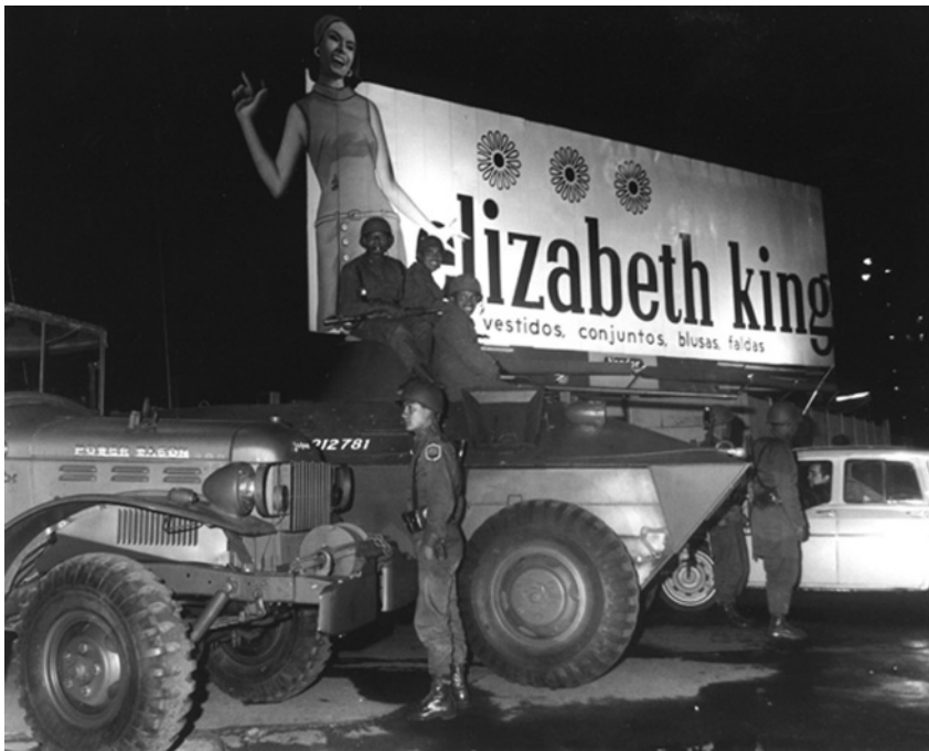
Foto 4. Soldados del ejército en los alrededores de Ciudad Universitaria, México. Rodrigo Moya, 18 de septiembre de 1968 (Archivo Fotográfico Rodrigo Moya).

militar del gobierno. En los siguientes dos meses, cientos de miles de jóvenes marcharon por las calles y reivindicaron la necesidad de un estado derecho en un país gobernado por un régimen de partido de estado. Fue un movimiento ágil y contestatario, que renovó las formas de protesta pública en el país y que fue violentamente reprimido por el Estado la tarde del 2 de octubre en la Plaza de las Tres Culturas en el barrio de Tlatelolco, en el norte de la ciudad de México, exactamente diez días antes del inicio de los XIX juegos olímpicos.