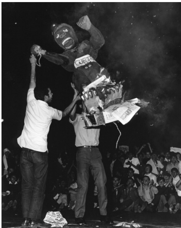
Foto 3. Estudiantes queman un gorila de papel maché que representa al Jefe de la Policía, México. Rodrigo Moya, 13 de agosto de 1968 (Archivo Fotográfico Rodrigo Moya).

Este movimiento surgió a finales del mes de julio de aquel año como una respuesta de los estudiantes del Instituto Politécnico Nacional y la Universidad Nacional Autónoma Nacional de México en contra de la represión policíaca y